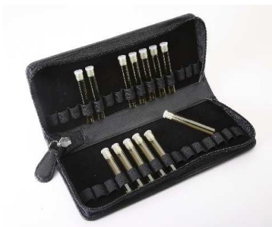
Ledermappe schwarz Nappa für 30 Gläser