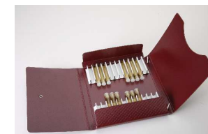
Pappe Mäppchen für 24 Gläser