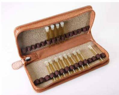
Ledermappe beige „Bioleder“ für 30 Gläser