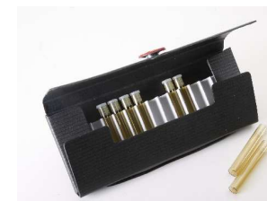
Pappe Mäppchen für 15 Gläser