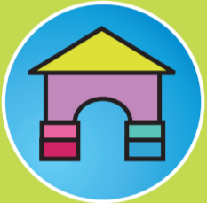
Bausteine des Lebens